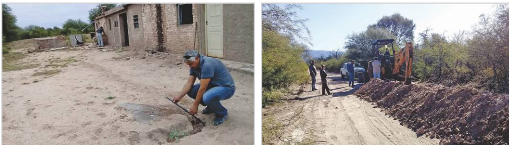
Figura 5. Detalles de pruebas de funcionamiento a boca de predio y excavación para tendido de tubería.

Contabilizando la interconexión entre reservorio existente y nueva cisterna, los ramales de distribución hacia El Cardonal y El Jarillal, se determinó acueducto de 8,3 km (3 km con tubería de 75 mm y 5,3 km de 50 mm). Se logró infraestructura con salidas de ½ pulgada de diámetro para el suministro de agua en viviendas y predios de las 16 familias participantes, Figura 5.