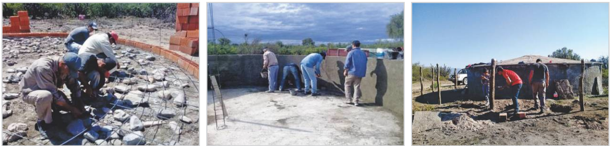
Figura 3. Proceso de construcción con cisterna asociada a ramales terciarios El Cardona y El Jarillal.