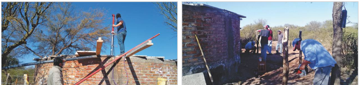
Figura 4. Instalación de sistema de bombeo y construcción de cierre perimetral en cisterna existente ramal secundario Talva.