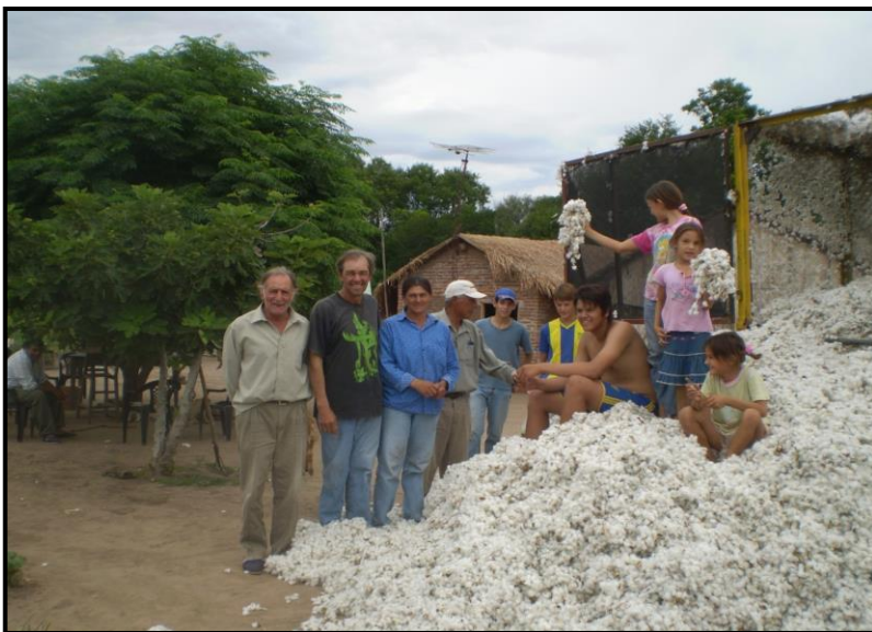
Imagen N°17: Cosecha de algodón: Esta imagen muestra una familia de pequeños

productores de Pirané Sur en época de cosecha del principal cultivo de renta el algodón.