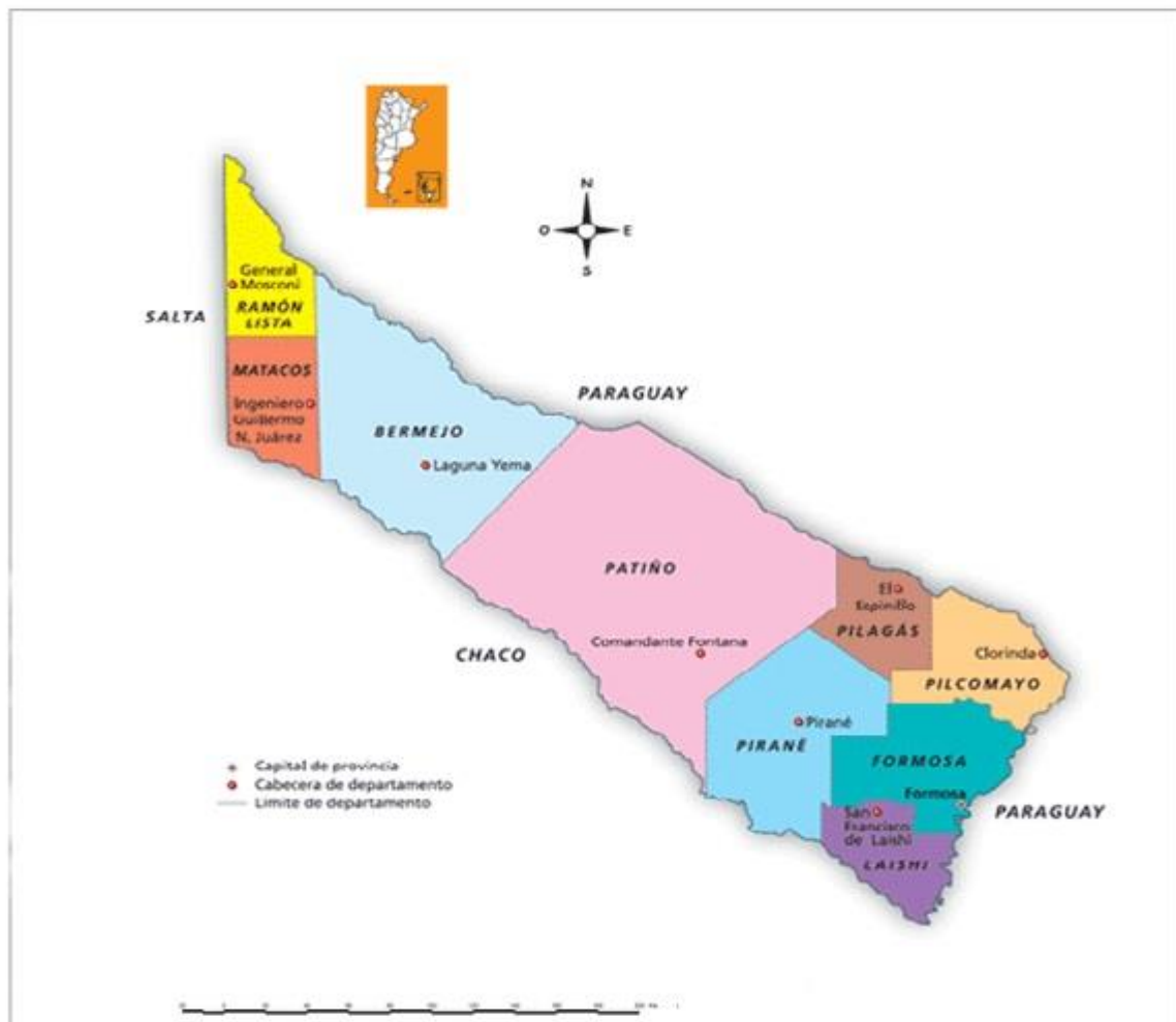
Figura 1: La Provincia de Formosa y sus Departamentos

Por el centro del departamento, cruza el riacho Salado en sentido de oeste a este, el cual determina una división: Pirané Norte y Pirané Sur. El segundo limita al Oeste con el departamento Patiño; al Este con el departamento Laishí; al Sur con el río Bermejo (que lo separa de la Provincia de Chaco); y hacia el Norte con el riacho Salado. Cuenta con una superficie de 323.800 has. (INTA AER El Colorado, 2010).