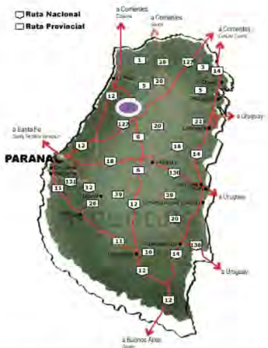
Figura 1 Ubicación de Maciá. Mapa de la Provincia de Entre Ríos

Los orígenes de Gdor Maciá remontan a fundación de estación del ferrocarril en el año 1899, con el objetivo de darle salida a la leña de la zona, junto a Maciá se fundaron otros cuatro pueblos (Durazno, Guardamonte, raíces y Gdor. Sola) estos tuvieron muy poco desarrollo y se han ido despoblando, además poseen índices de NBI superiores (PROINDER, 2005). La corriente inmigratoria más importante que recibió fue de ruso-alemanes o alemanes del Volga, también italianos y judíos. Es municipio desde el año 1946, cambiando a municipio de primera categoría en el año 1994, este cambio implicó tener un poder ejecutivo y un concejo deliberante, además que el poder ejecutivo este autorizado a cobrar impuestos, a recibir parte de las coparticipaciones y desde 2008 fondos provenientes de la soja. Es la segunda ciudad en importancia del departamento Tala, no está sobre ninguna ruta importante, desde el año 1977 no hay ferrocarril.