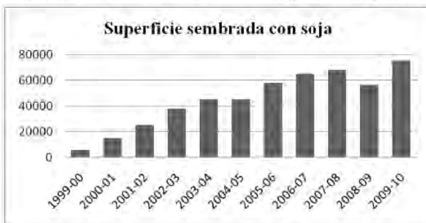
Figura 2. Evolución del cultivo de soja en el departamento Tala (sup. en ha). Hegglin, 2011.

4.263.000 en el año 2011. En líneas generales la ganadería se traslada a lotes de menor calidad (PROINDER, 2005). Esto trae aparejado un cambio importante en la dinámica de la región ya que esta nueva agricultura no está hecha en una gran mayoría por el productor, dueño del campo, sino por un arrendatario local o de fuera del territorio, por lo cual en lo que respecta a la proporción agrícola del establecimiento el productor se transforma en rentista (Hegglin, 2011). Este ingreso proveniente del arriendo de los campos se manifiesta en las inversiones inmobiliarias que se realizaron en Maciá en los últimos años por parte de productores.