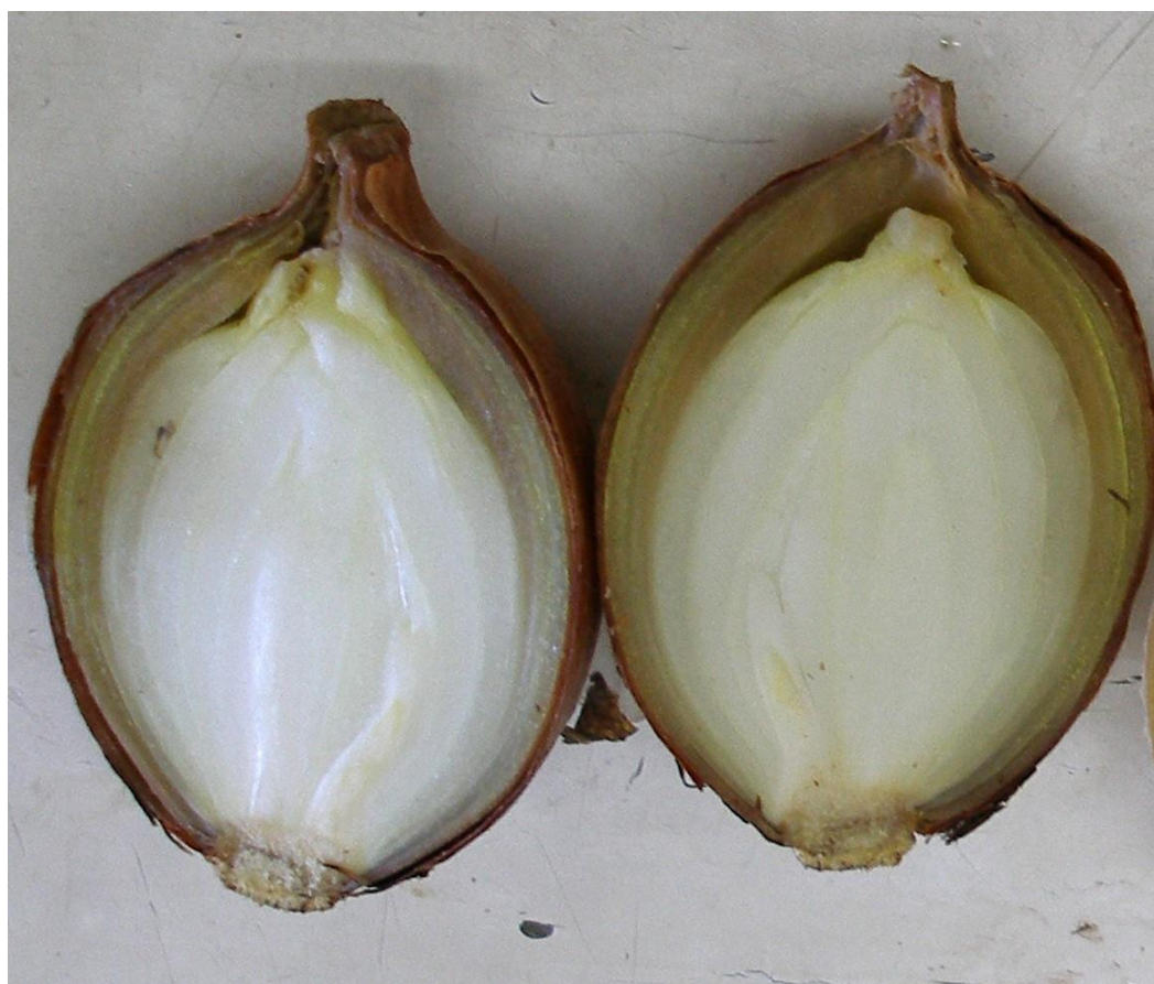
Fig. 4: Podredumbre avanzando a lo largo de catafilos externos