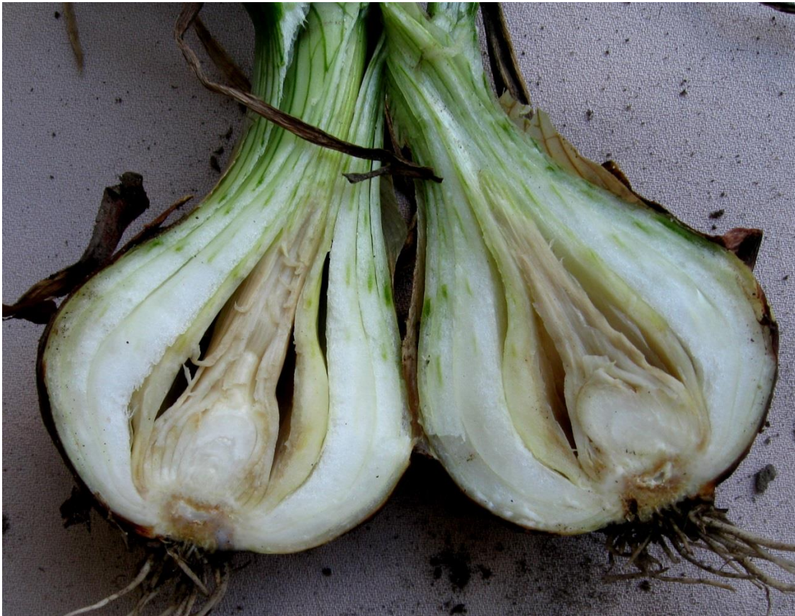
Fig. 5: (A y B) Podredumbre avanzando en catafilos internos; nótese que los cortos catafilos centrales, que no poseen lámina, aún permanecen sin infección aparente