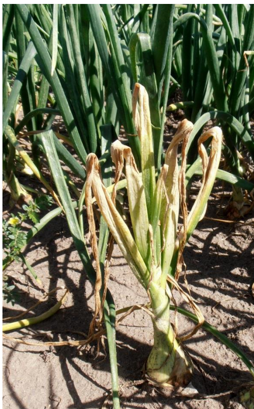
Fig. 2: Muerte regresiva en planta