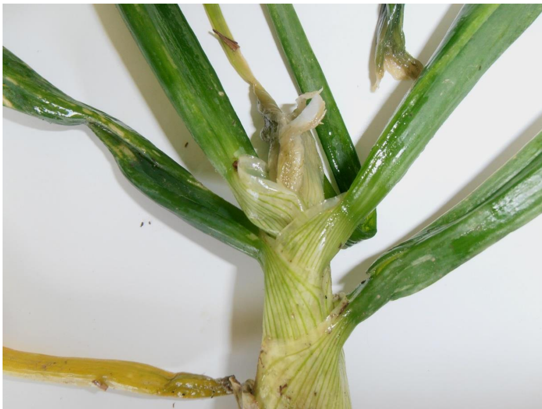
Fig. 1: Podredumbre blanda acuosa en las hojas centrales más jóvenes del pseudotallo