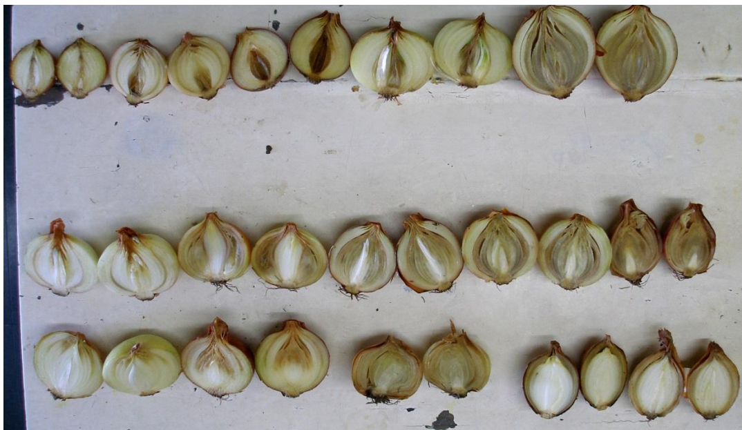
Fig. 3: Diversos tipos de podredumbre bacteriana en bulbos