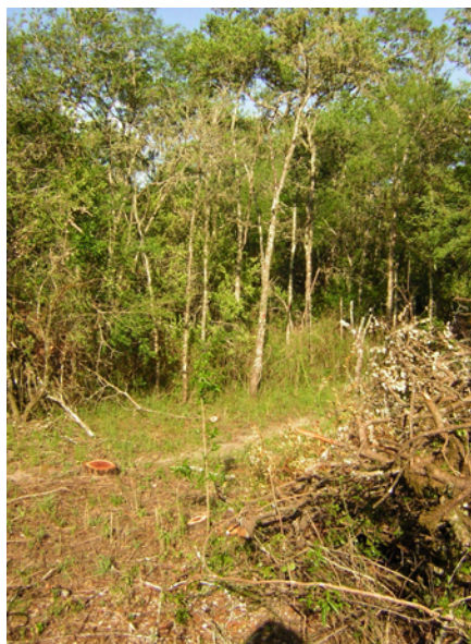
Foto 4.4: Aplicación al tocón de un arboricida disuelto en mezcla de gasoil-aceite quemado.

Al octavo año de haberse iniciado el manejo silvopastoril, el manejo de la Parcela Tratada, dio como resultado: incremento de la disponibilidad de madera; incremento en la disponibilidad de forraje e incremento de ganancia de peso vivo/ha/año, en la producción ganadera, respecto de la Parcela Testigo. Con los crecimientos obtenidos y la regeneración natural (Foto 4.5) lograda en ocho años de estudio (corroborados en predios de productores), el ciclo de corta de aprovechamiento forestal rondaría los doce años. (27)