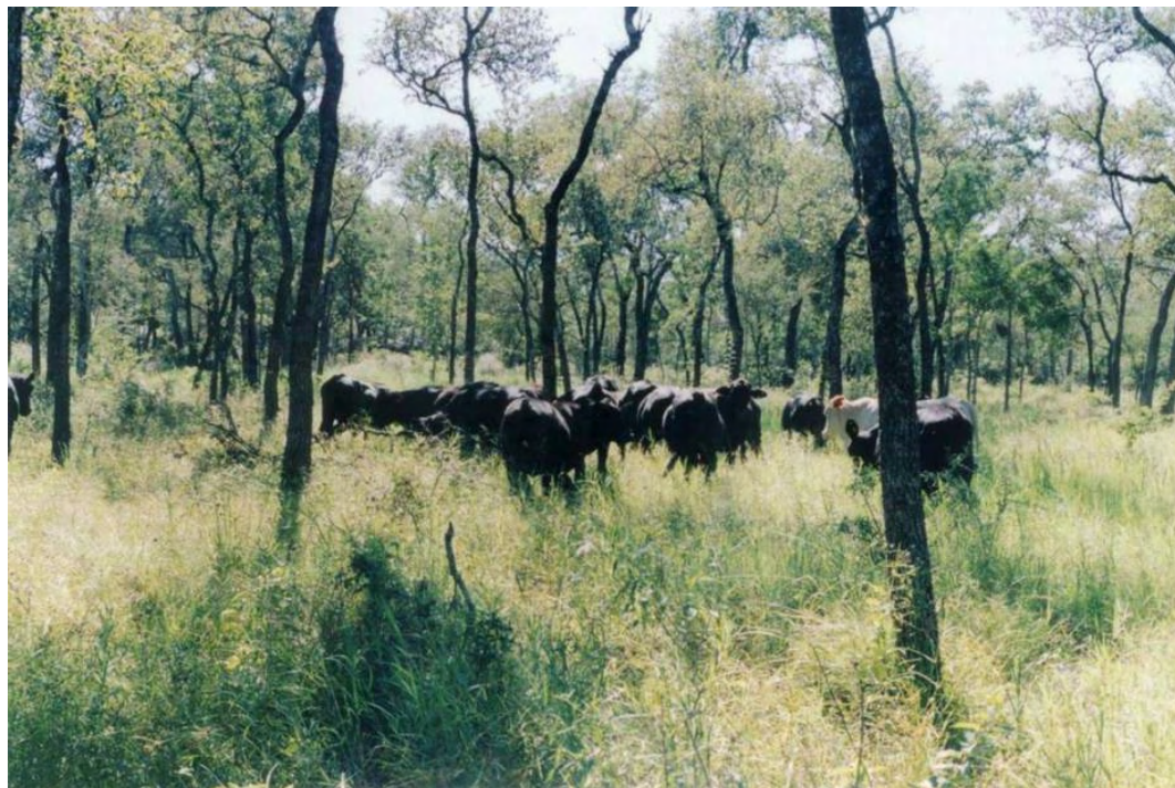
Foto 4.6: Sistema Silvopastoril en una empresa agropecuaria del este de la Provincia del Chaco.

Esta proyección del aprovechamiento, del bosque (27), se tuvo en cuenta para elaborar la proyección a 12, 24 y 36 años, de la evaluación económica-financiera del sistema Silvopastoril en estudio.