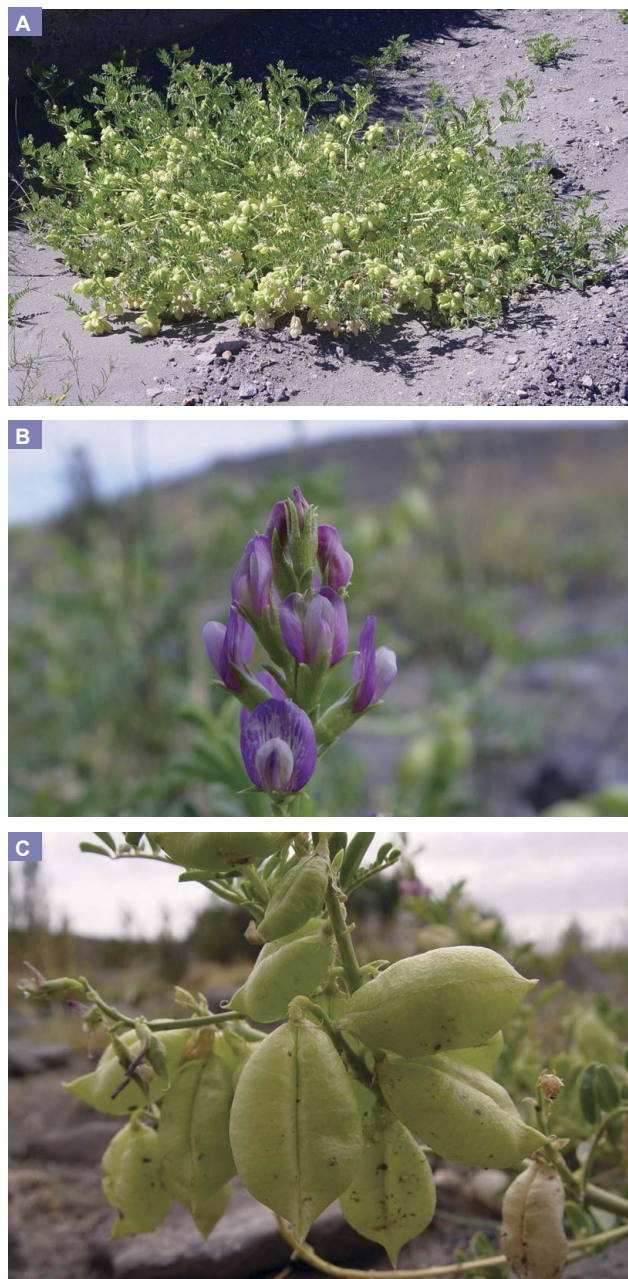
Figura 2. (A) Especímen de Astragalus pehuenches de gran tamaño. (B) Inflorescencia violácea y (C) frutos globosos característicos de Astragalus pehuenches .

m s. n. m., generalmente ajustándose a un patrón de distribución por manchones, en áreas de peri mallín, pampas arenosas y en lugares donde el suelo en algún momento fue removido, coincidiendo con lo reportado por Gómez-Sosa (1979).