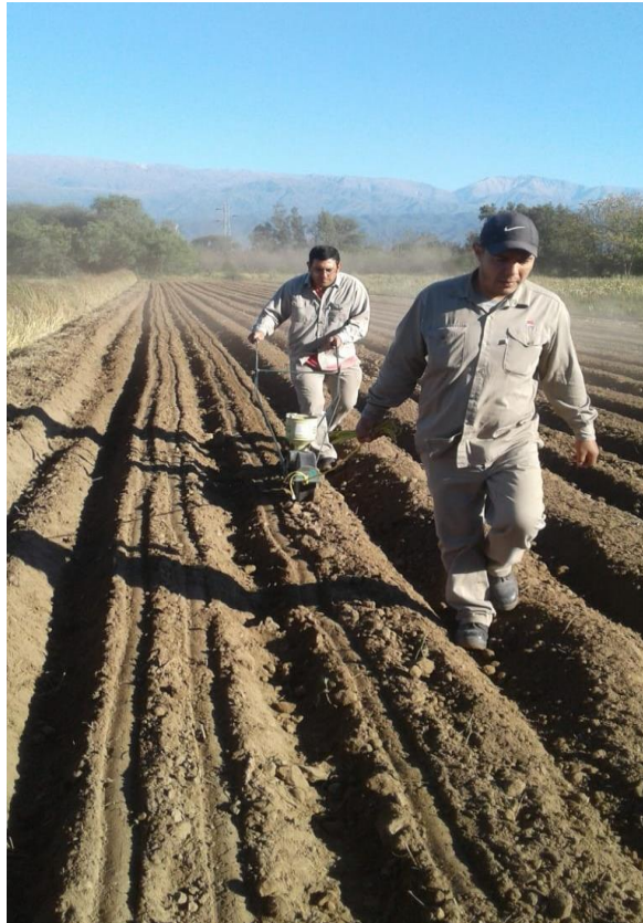
Foto1: Dos operarios sembrando con sembradora manual sobre platabanda

La siembra se realizó sobre suelo húmedo y laboreado convencionalmente, con sembradora manual tipo planet, a doble cara sobre platabanda, separadas 70 cm entre platabandas y 35 cm entre líneas (Foto1), utilizando 12 kg de semilla por ha, posterior a la siembra se aplicó herbicida selectivo pre-emergente.