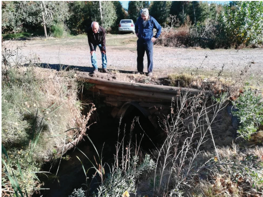
Figura 3: Técnicos del DPA y el Consorcio evaluando el estado de uno de los puentes, identificados en el recorrido como puntos críticos

Puente 7: Hacer muros de ala y limpiar material. Puente con losa nueva.