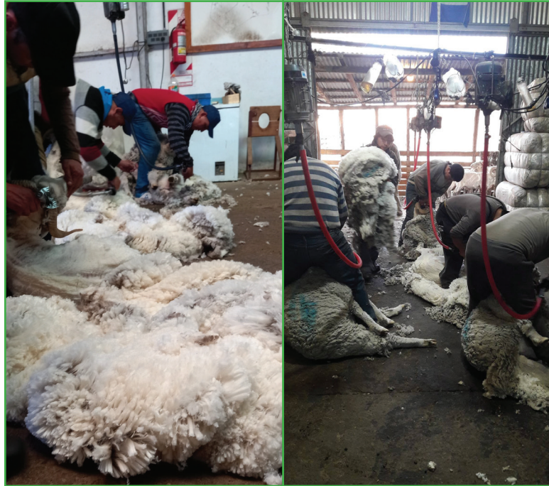
Figura 1: Esquila de ovinos Merino en la Provincia de Río Negro.