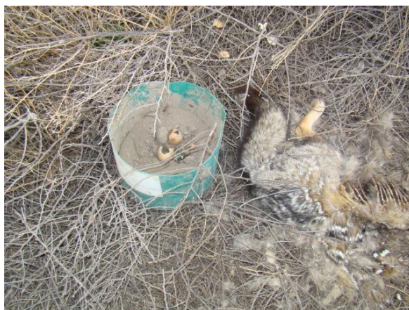
El zorro gris pampeano ( Lycalopex gymnocercus ). Control usando cebos toxicos.

Los métodos letales que son utilizados son el uso de cebos tóxicos, la captura con jaulas o trampas cebo, la caza con