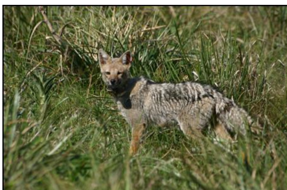
El zorro gris pampeano ( Lycalopex gymnocercus ).

El zorro gris pampeano ( Lycalopex gymnocercus ) es un cánido de tamaño mediano que pesa entre 4 y 8 kg. Las hembras son monoéstricas. El celo y la cópula ocurren a finales del invierno, dando a luz 60 días después una camada que oscila entre 2 y 8 crías. En los meses de setiembre y diciembre (Crespo 1971; Redford y Eisenberg 1992). El periodo de lactación dura 2 meses y los cachorros