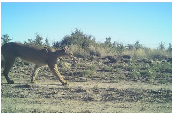
Puma ( Puma concolor ).

El puma ( Puma concolor ) es el mamífero silvestre con el rango de distribución más amplio de todo el continente y el predador tope de gran parte de nuestro país solo superado en algunas regiones por el Yaguarete ( Panthera onca ). El peso promedio de los individuos adultos puede variar entre 53 y 80 kg, para los machos y entre 35 y 48 kg, para las hembras.