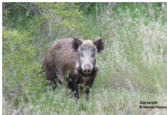
Jabalí europeo ( Sus scrofa )

El jabalí ( Sus scrofa ) pertenece a la familia Suidae, orden Artiodactyla. En la Argentina, las poblaciones que se encuentran son descendientes asilvestrados de las razas de cerdos domésticos liberados durante la colonización española de ejemplares de jabalí euroasiático puro que fueron deliberadamente introducidos alrededor de 1906 con propósitos cinegéticos. La hibridación entre poblaciones silvestres y cerdos domésticos criados a campo también es común, resultando en un patrón muy confuso de distribución e interrelaciones entre las variedades domésticas, silvestres y formas híbridas (Carpinetti et al., 2014).