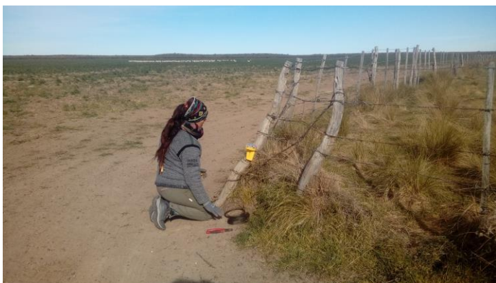
Colocación de luces disuasivas en un alambrado.

La aversión condicionada al sabor (ACS) es un patrón de comportamiento que un animal adquiere al asociar un estímulo gustativo con un malestar gastrointestinal, que posteriormente provocará un cambio en la conducta del animal evitando el alimento en los próximos encuentros. A pesar del amplio respaldo la eficacia de ACS en los estudios de laboratorio, los estudios de campo han mostrado resultados mixtos, lo que erosiona la confianza de los ganaderos en el uso de esta herramienta. Algunos trabajos experimentales en campo en la Pcia de Buenos Aires con zorros han dado resultados no concluyentes (Morales Pontet 2019) pero en Patagonia los resultados han sido satisfactorios y prometedores (Nielsen et al. 2015) y también han dad muy buenos resultados en experiencia a campo con los zorros colorado europeo Vulpes vulpes (Tobajas et al. 2019).