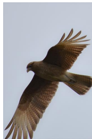
Chimango (Milvago chimango).

Respecto a las aves de rapiña, muchos productores ganaderos argumentan que, durante el periodo de parición de terneros y corderos, las aves carroñeras arriban en números grandes a los cuadros de parición y atacan tanto a madres como a corderos. Los ataques son realizados a través de picotazos en el ano, periné, ubres y ombligo del neonato, generando heridas graves que muchas veces llevan a la muerte del cordero, madre o ambos. Esto genera gran preocupación entre los productores, quienes le atribuyen a estas aves gran parte de las pérdidas de la producción. Hay algunos estudios que han analizado el papel depredador potencial de las aves carroñeras sobre el