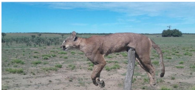
Puma ( Puma concolor ) cazado en el partido de Patagones.

La respuesta más común a este tipo de problema es la eliminación de los predadores (Linnell et al., 1996). Sin embargo, se trata soluciones temporarias y la remoción de