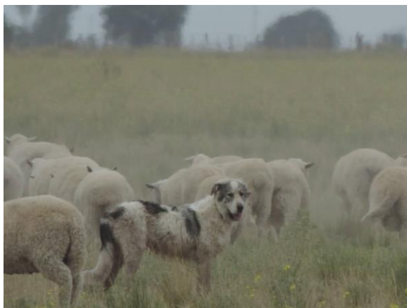
Perros protectores en majadas ovinas.

El uso de perros protectores es un método tan antiguo como la domesticación misma y, si bien ha demostrado ser efectivo en muchos casos (Gehring et al., 2011; Gonzales et al., 2012), algunos trabajos han concluido que debe complementarse con otras medidas (Iriarte et al. 2012) y debe evaluarse para qué especies y en que situaciones ambientales y productivas es una herramienta