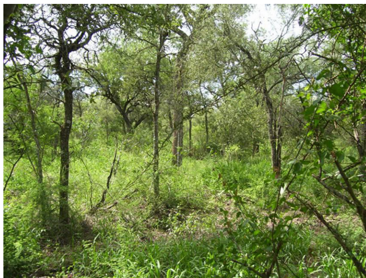
Figura 1b. Ejemplo de un lote con rolado de baja intensidad bajo Manejo de Bosques con Ganadería Integrada (MBGI) en Santiago del Estero.

Buscando atender esta situación fue que se impulsó el desarrollo de manejo de bosques con ganadería integrada (MBGI).