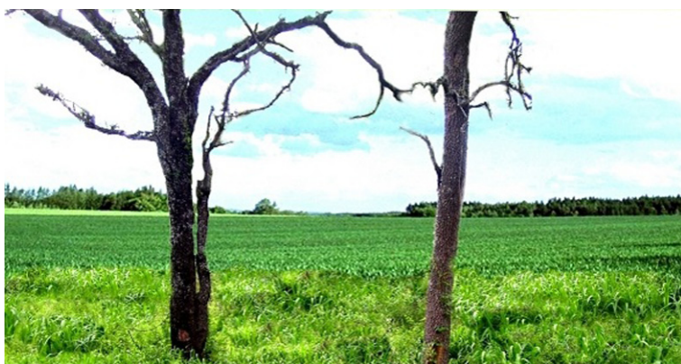
Figura 1a. Ejemplo de los mal denominados sistemas silvopastoriles en el Parque Chaqueño con intervenciones muy intensivas y no sustentables.

En síntesis, la aplicación de prácticas y esquemas de intervención se realizaban de una manera que no permitían la subsistencia del bosque, y que, en algunos casos, recibían subsidios de la misma ley de bosques.