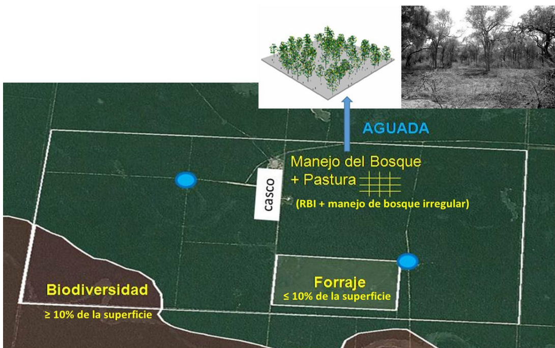
Figura 3. Esquema de distribución espacial a nivel predial de la propuesta Manejo de Bosques con Ganadería Integrada (MBGI) para Bosques del Chaco Semiárido de la provincia de Santiago del Estero (Navall et al. , 2016).

En el país, diez provincias formalmente adhirieron al Convenio MBGI con diferentes grados de avance. Las provincias de Salta, Chaco, Formosa y Santiago del Estero firmaron la adhesión al convenio MBGI en el año 2015. Las provincias Patagónicas (Neuquén, Río Negro, Chubut, Santa Cruz y Tierra del Fuego) firman el convenio en el año 2016