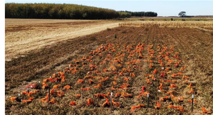
Figura 2 : Disposición de los puntos de muestreo en uno de los lotes.