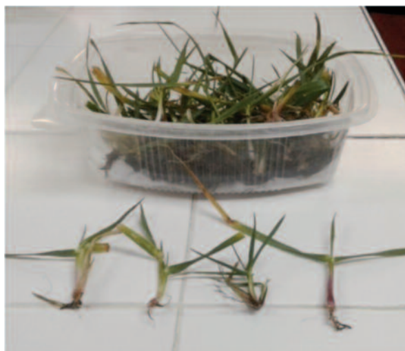
Figura 2. Bandeja con macollos listos para ser analizados.

(Figura 1C), dado que el análisis no se realiza sobre la lámina de la hoja (aquí la concentración de alcaloides es baja).