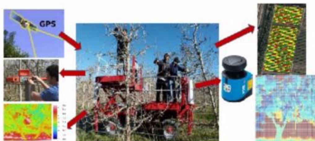
Incorporación de sensores a la plataforma.

cidas y fungicidas por costos y por la demanda creciente de los consumidores que cada día exigen más productos orgánicos.