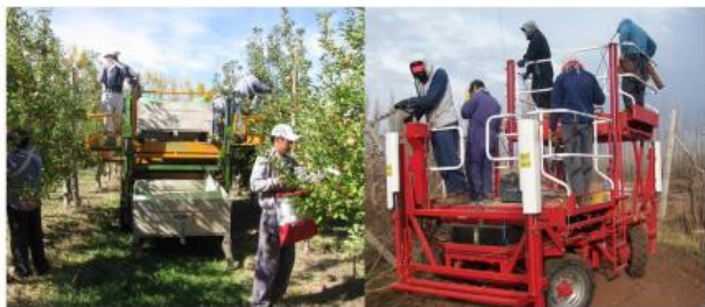
Plataformas para poda, cosecha y otras tareas culturales.