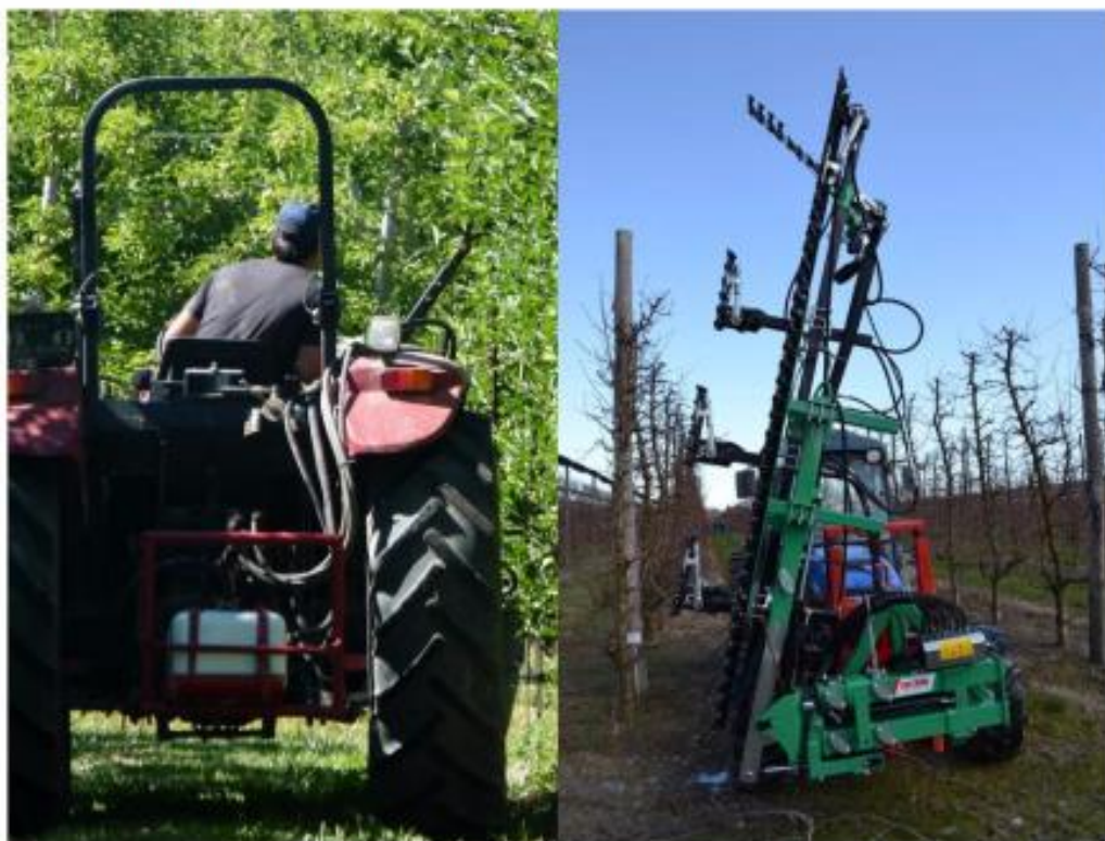
Sistema de conducción en muro frutal (izquierda). Podadora de cizalla (derecha).

costo de inversión de capital. El método manual predominará durante los próximos años, por este motivo el desarrollo tecnológico se ha dirigido como auxiliar en el mejoramiento de la capacidad y calidad de trabajo de los operarios. Debido a esta realidad se han adoptado las ayudas mecánicas para poda y cosecha. Esta adopción, conocida desde hace décadas en Europa, se está instalando con fuerza en la actualidad en otras regiones frutícolas del mundo. El uso de ayudas mecánicas permite un fuerte aumento de la productividad, pero fundamentalmente una mejora en la calidad del trabajo con mayor inclusión de obreros, que por cuestio-