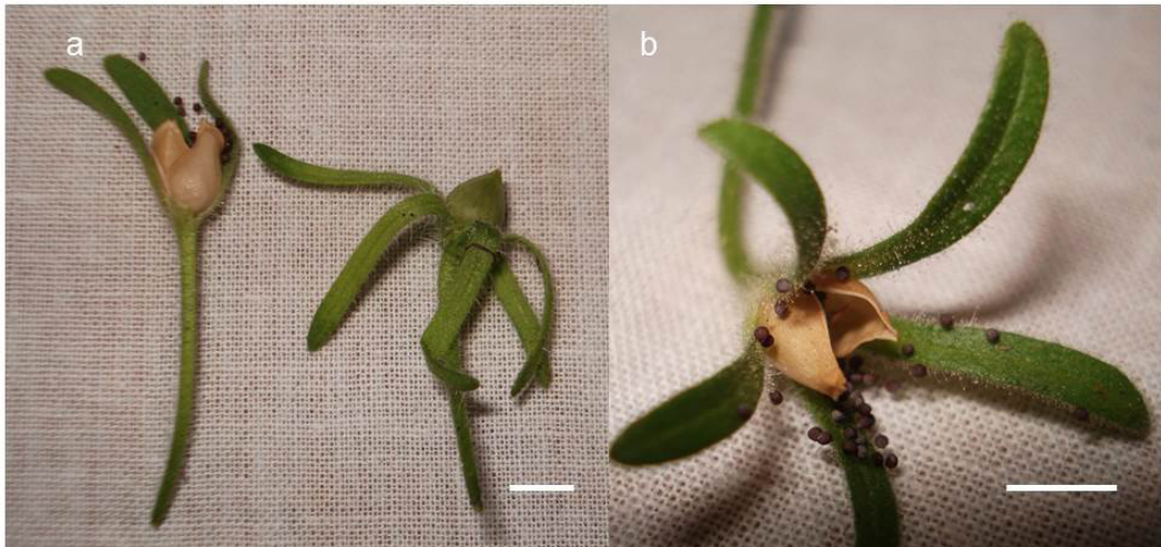
Fig. 2. Formación de frutos en especies nativas de Petunia utilizadas en los cruzamientos intergenéricos. a- Frutos de Petunia inflata x Calibrachoa caesia . b- Fruto con dehiscencia de Petunia inflata en cruzamiento testigo ( P. inflata x P. inflata ). Aumento: barra = 4 ml

Fig. 1. Fruit formation in native Petunia species used in intergeneric crosses. a- Petunia integrifolia x Calibrachoa thymifolia . b- Petunia integrifolia x Calibrachoa caesia . c- Petunia integrifolia x Calibrachoa x hybrida 'kabloom yellow'.