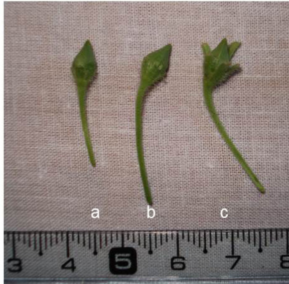
Fig. 1. Formación de frutos en especies nativas de Petunia utilizadas en los cruzamientos intergenéricos. a- Petunia integrifolia x Calibrachoa thymifolia . b- Petunia integrifolia x Calibrachoa caesia . c- Petunia integrifolia x Calibrachoa x hybrida 'kabloom yellow'.

Fig. 1. Fruit formation in native Petunia species used in intergeneric crosses. a- Petunia integrifolia x Calibrachoa thymifolia . b- Petunia integrifolia x Calibrachoa caesia . c- Petunia integrifolia x Calibrachoa x hybrida 'kabloom yellow'.