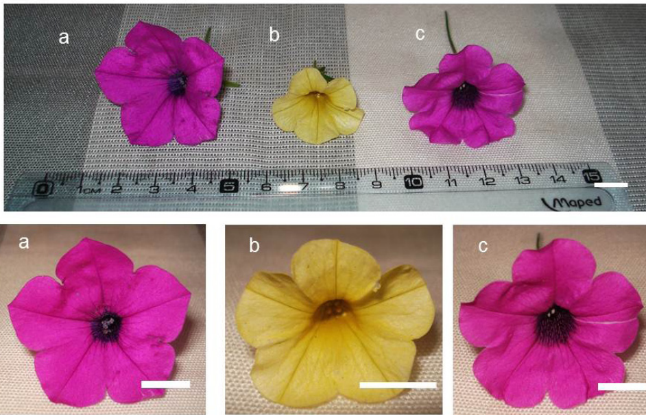
Fig. 5. Características morfológicas de la flor del híbrido HPC y sus parentales. a- Detalle de la flor de Petunia inflata . b- Detalle de la flor de Calibrachoa hybrida 'kabloom yellow'. c- Detalle de la flor de HPC. Aumento: barra = 10 ml